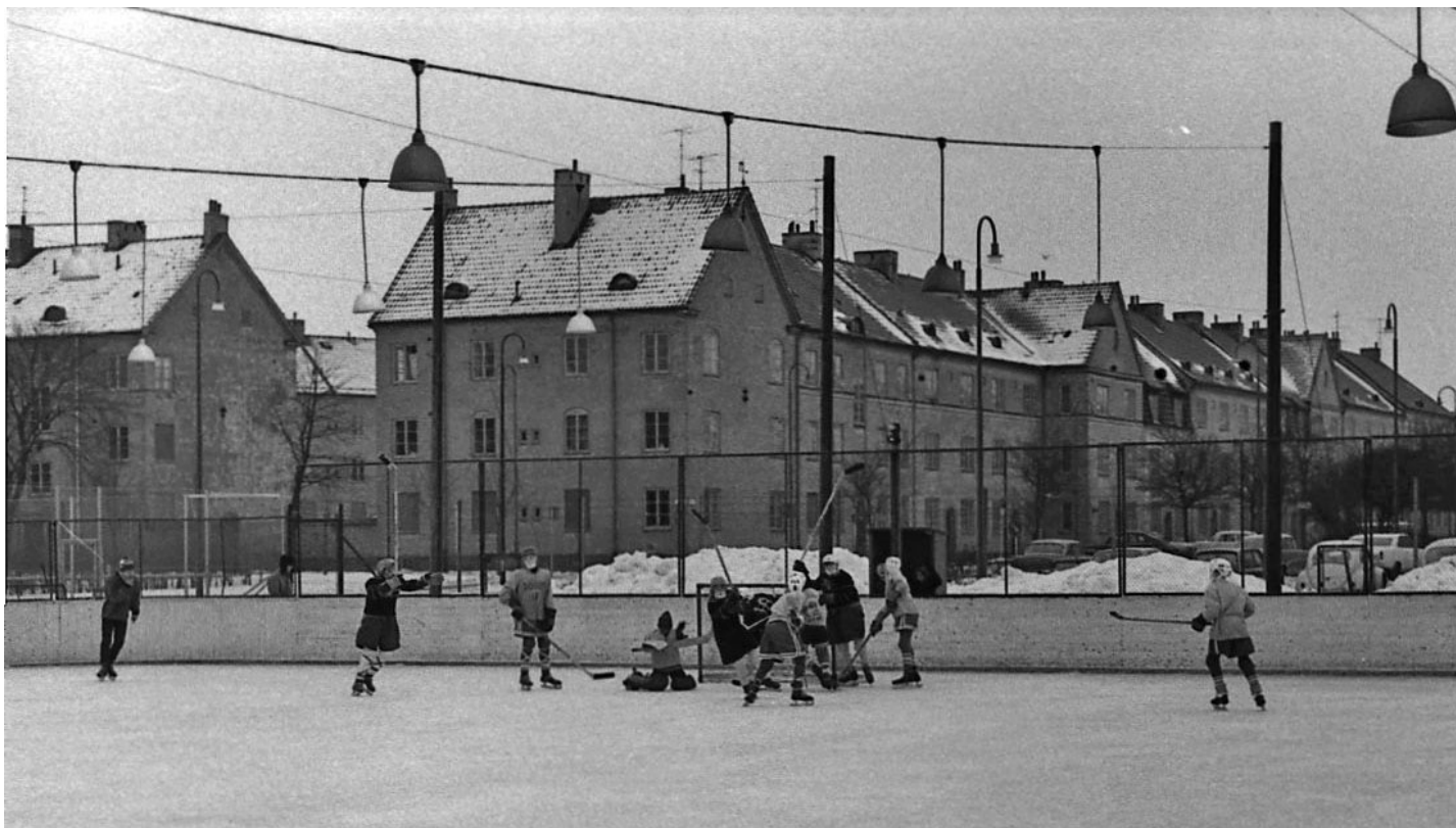
Pojklagsmatch på Östra isbanan